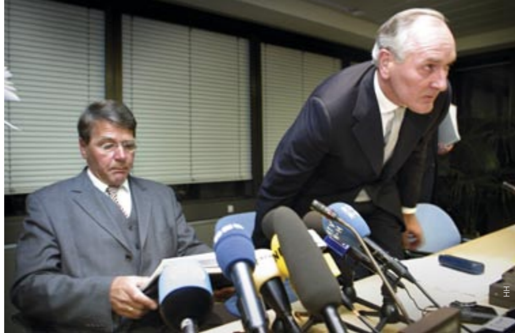
Links (voormalig) minister van Justitie Donner, rechts minister van Binnenlandse Zaken Remkes, verantwoordelijk voor de AIVD.

Is daarmee dan alles gezegd en geschreven? Kan het boek van deze tragische geschiedenis, die het aanzien van het als gezapig en tolerant bekendstaande Nederland in elk geval voor enige tijd veranderde, dicht? Moord opgelost - over tot de orde van de dag? Nee, dat zou onterecht zijn. Al vanaf de dag dat Theo van Gogh op de Amsterdamse Linneausstraat als een varken werd geslacht, nu exact twee jaar geleden, zijn er vraagtekens gerezen over wat de autoriteiten van de latere moordenaar