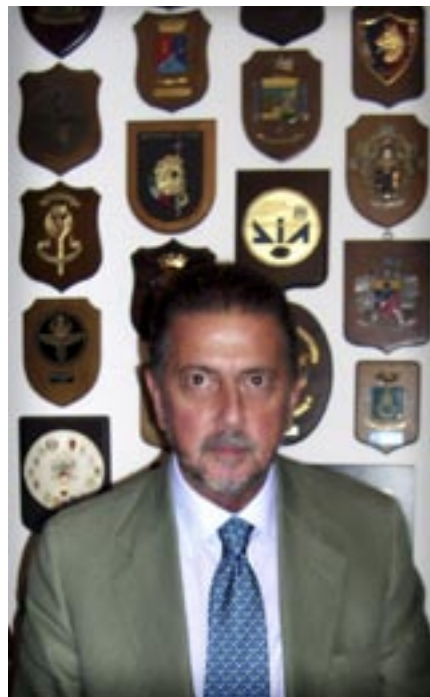
Cataldo Motta, de openbare aanklager en maffiosi-jager in Lecce.

Dat de maffia stevige voet op Nederlandse bodem heeft, werd eerder blootgelegd door een onderzoekscommissie onder leiding van criminoloog Fijnout, in de sliptstream van de IRT-affaire. Al in de jaren zeventig, zo bleek, waren Italiaanse organisaties actief in ons land, waarbij ook gebruik werd gemaakt van hier al langer verblijvende Italianen. 'Het staat dus buiten kijf dat de Italiaanse maffia, en in het bijzonder de Camorra, op Nederlands grondgebied opereert en dat haar optreden hier als het ware de harde kern vormt van veel ruimere criminele betrekkingen tussen Nederland en Italië,' concludeerde de commissie. Nederland staat bekend als transitoland