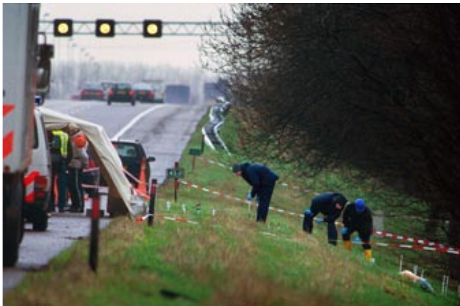
Onderzoek naar de zogenoemde A12-moorden in 2002 waarbij twee Brazilianen werden vermoord in opdracht van Cerfeda.

bedoening is,' vertelt Longo, is de organisatie van meet af aan 'klunzig'. Typerend voor de SCU is bijvoorbeeld dat een aantal drugsverslaafden tot de leiding weet door te dringen. 'Iets dat in de mafia normaal gesproken uit den boze is. Een drugsverslaafde denkt alleen hoe hij aan verdovende middelen komt en is per definitie onbetrouwbaar en niet loyaal.' Ook is steeds onduidelijk wie er nu de echte baas is binnen de SCU. Het leidt tot een onafzienbare reeks vendetta's. Dat vele SCU-leden met het grootste gemak overlopen naar de Italiaanse overheid om hun maten te 'ver-