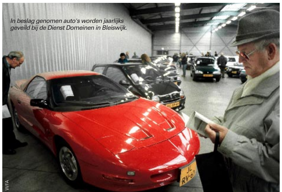
In beslag genomen auto's worden jaarlijks geveild bij de Dienst Domeinen in Bleiswijk.

bestudeert, ziet een indrukwekkend aantal ontnemingsmaatregelen dat in den lande werd opgelegd. Alleen al bij de meervoudige kamers (rechtbanken, gerechtshoven) ging het om bijna 1100 zaken, goed voor een bedrag van ruim 90 miljoen euro. Daar kwamen nog eens duizenden zaken bij politierechters bij. Het jaarverslag staat dan ook bol van loftuigen en optimisme. Maar een droog cijfer onder de ►