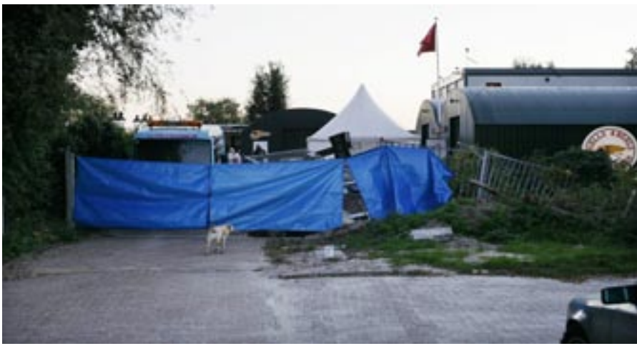
HH Inval van de politie in Angel Place, Amsterdam, 17 oktober 2005.

► Harlingen enzovoorts worden opgericht. Het gedogen zal tot het begin van deze eeuw voortduren. Een dieptepunt vormen de onderhandelingen die de gemeente Amsterdam opent om de plaatselijke afdeling te doen verhuizen. De gemeente beschouwt het terrein aan de Wenckebachweg als een interessante vestigingslocatie voor bedrijven, maar dan wel zonder motorduivels om de hoek. In 2001 wordt een architect ingeschakeld om een schets van een nieuw clubhuis te maken. Het resultaat is een burcht van zestien meter hoog, inclusief slotgracht en uitkijkpost. Onderhuidse boodschap: de Angels hebben lak aan de maatschappij en verdienen een eigen (vrij)plaatsje onder de zon. Kosten van het kasteel: meer dan een miljoen euro. "Men wilde scoren bij de Hells Angels - dat was wel duidelijk," aldus de architect in Het Parool. De welstandscommissie keurt het 'onbevreesde ontwerp' goed. Maar op het laatst wordt het plan afgeblazen.