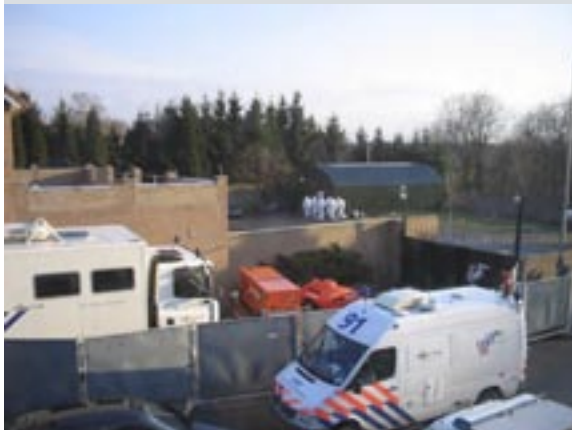
De technische recherche onderzoekt de loods op het Nomads- terrein in Oirsbeek.

■ Wing Vleugel op jack. Kan diverse kleuren en betekenissen hebben. Zo zou een rode wing betekenen: in het bijzijn van andere Angels sex hebben met 'n vrouw tijdens haar menstruatie. En een groene wing: sex met een vrouw die een seksueel overdraagbare aandoening heeft.